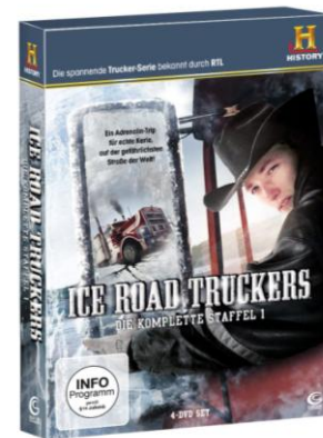
Ice Road Truckers Die Komplette Staffel 1