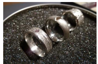
Bagues de fiançailles : « Cosy Rings » et diamants cognac.