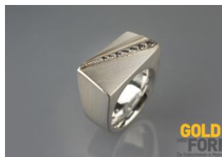
Bague de fiançailles : bague argent avec or blanc et diamants gris. © Gold und Form (Meersburg)

« Nos clients recherchent l'exceptionnel et ils souhaitent aussi exprimer cela dans le choix de leur bague de fiançailles et de leurs alliances. La « traditionnelle » bague de fiançailles d'après le modèle américain (un diamant aussi gros que possible sur un anneau aussi petit que possible) n'est pratiquement plus demandée par notre clientèle. Celle-ci est davantage à la recherche d'une bague personnalisée correspondant bien à sa partenaire et qui signifie exactement : « Tu es exceptionnelle ».