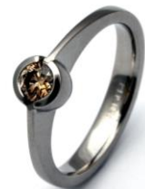
Bague de fiançailles : Palladium 950, brillant 0.24 ct, Fancy Brown.

« Dans le choix des pierres, nos clients sont de plus en plus séduits par les diamants en général et par les Diamants de Couleur Naturelle en particulier. Nous pensons que les photos sur notre site web parlent d'elles-mêmes. »