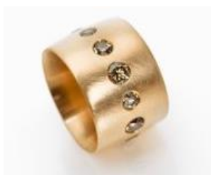
Bague de fiançailles : or rose 750, brillants couleur champagne.

« Eva Niemand: la longévité et la transmissibilité par succession sont les arguments majeurs des futurs époux se décidant pour des diamants incolores. Mais les Diamants de Couleur Naturelle, c'est plus que cela, ce sont des pièces uniques non interchangeable qui s'allient harmonieusement et au métal et aux personnes qui les portent. »