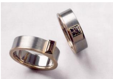
Alliances : or blanc 750 et or rouge, bague et princesse, couleur cognac.

« Le plus important, c'est l'information donnée. Pour moi, les diamants blancs présentent souvent un aspect trop dur. Les Diamants de Couleur Naturelle, en particulier les tons de champagne et de cognac, s'harmonisent plus facilement avec les différents types de peau. »