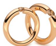
Serti pincé Niessing* : or rouge, brillants champagne. © Niessing Manufaktur (Vreden)

« La bague de fiançailles est clairement à la mode. Nous proposons volontiers à nos clients des Diamants de Couleur Naturelle en alternative aux brillants incolores. A titre d'exemple, les tons chauds des diamants champagne s'harmonisent particulièrement bien à l'or rouge. Les Diamants de Couleur Naturelle sont devenus indispensables à notre gamme de produits. »