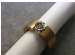
Bagues de fiançailles : brillants champagne clair.

« Les Diamants de Couleur Naturelle possèdent un attrait plein de charme et de mystère. Pour une bague de fiançailles, en alternative à un diamant incolore, je propose volontiers un brillant champagne clair. »