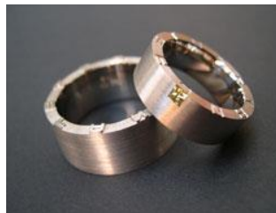
Alliances : or blanc 750, princesse couleur champagne.

« Nous apprécions les Diamants de Couleur Naturelle pour leur personnalité singulière et la diversité unique de leur couleur. Les clients accordant une grande importance à l'expression de leur individualité, rompent volontiers avec la tradition et se décident pour ces pierres inhabituelles. »