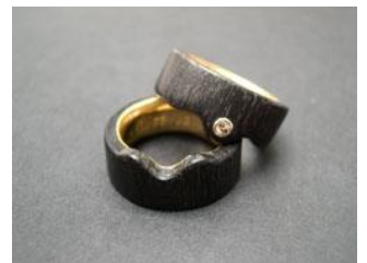
Alliances : or 18 ct, bois d'ébène, brillant de couleur naturelle.