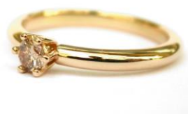
Bague de fiançailles : brillant rose.

« La plupart du temps, ce sont les diamants incolores qui sont demandés pour les bagues de fiançailles. Néanmoins, les clients qui souhaitent et un diamant et une touche de couleur pour leurs alliances sont enthousiasmés par la diversité de couleur des Diamants de Couleur Naturelle. »