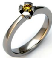
Bague de fiançailles : Or blanc 750, brillant 0.16 ct, Fancy Yellow. © Rieger & Schnaas Goldschmiede (Tübingen)

« Dans le choix des pierres, nos clients sont de plus en plus séduits par les diamants en général et par les Diamants de Couleur Naturelle en particulier. Nous pensons que les photos sur notre site web parlent d'elles-mêmes. »