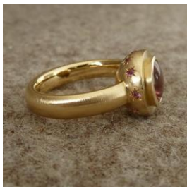
Bague de fiançailles : or jaune 750, tourmaline, brillants roses. © Form-Werk (Cologne)

« J'ai moi-même une grande passion pour les Diamants de Couleur Naturelle et je remarque aussi un intérêt croissant de la part de mes clients. La demande est en hausse. »