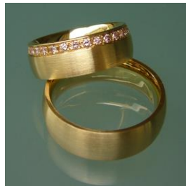
Alliances : or jaune 750, brillants roses.