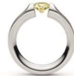
Serti pincé Niessing* Everest : platine, brillant Fancy Yellow.