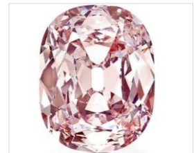
Princie Diamond (34.65 ct) Fancy Intense Pink

Selon la tradition indienne, les Nizâm avaient un droit de préemption sur les plus beaux diamants des mines de Golconde. On croyait alors que l'énergie renfermée dans les pierres se transmettait à leur propriétaire.