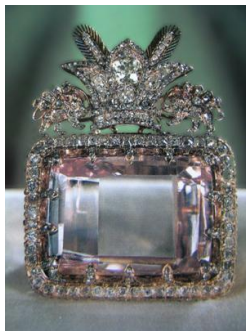
Darya-i-Nur (186.00 ct) Light Pink

Les mines de Golconde sont réputées pour leurs diamants de couleur naturelle d'une beauté particulière, possédant une couleur insolite ainsi qu'une transparence remarquable. C'est de ces mines que proviennent les trois plus gros diamants roses : le Darya-i Nur , le Nur-ul-Ain et le Princie Diamond .