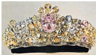
Nur-ul-Ain (60.00 ct) Light Pink