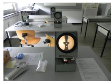
Le proportion scope fournit des données en pourcentage sur les proportions et sur quelques caractéristiques de symétrie des brillants ronds et des tailles de brillant modifiées.

Mais les quatre semaines ont porté leurs fruits. Ma vue s'est affinée et j'ai appris à concentrer mon œil sur des zones bien précises afin par exemple d'observer plus exactement la disposition des facettes ou de déterminer le type d'une caractéristique interne.